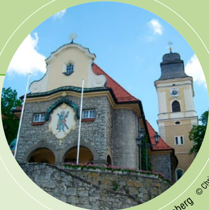
St. Andreas, Parsberg