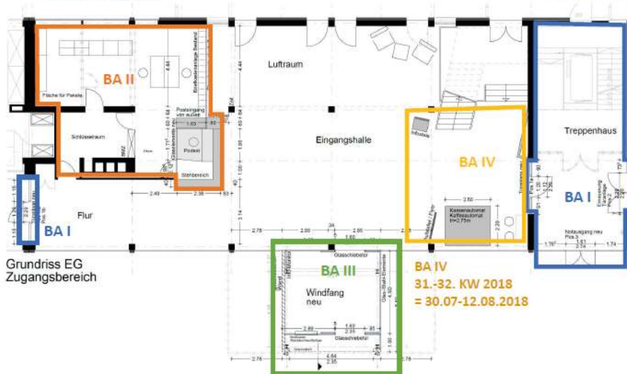
Grundriss EG Zugangsbereich

BA I 18.-22. KW 2018 = 30.04.-03.06.2018