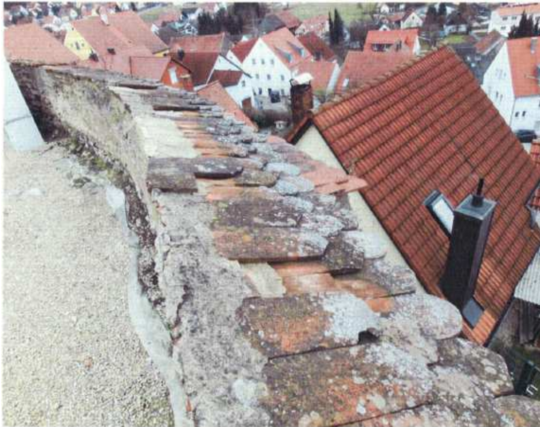
Abbildung 1: Mauerkronenabdeckung mit Biberschwanzziegeln, durch das Zusammenspiel mit Frost und Wasser kam es zu Sprengungen. Aufgrund der geringen Brüstungshöhe kann auch Vandalismus zum Schadensbild mit beigetragen haben.