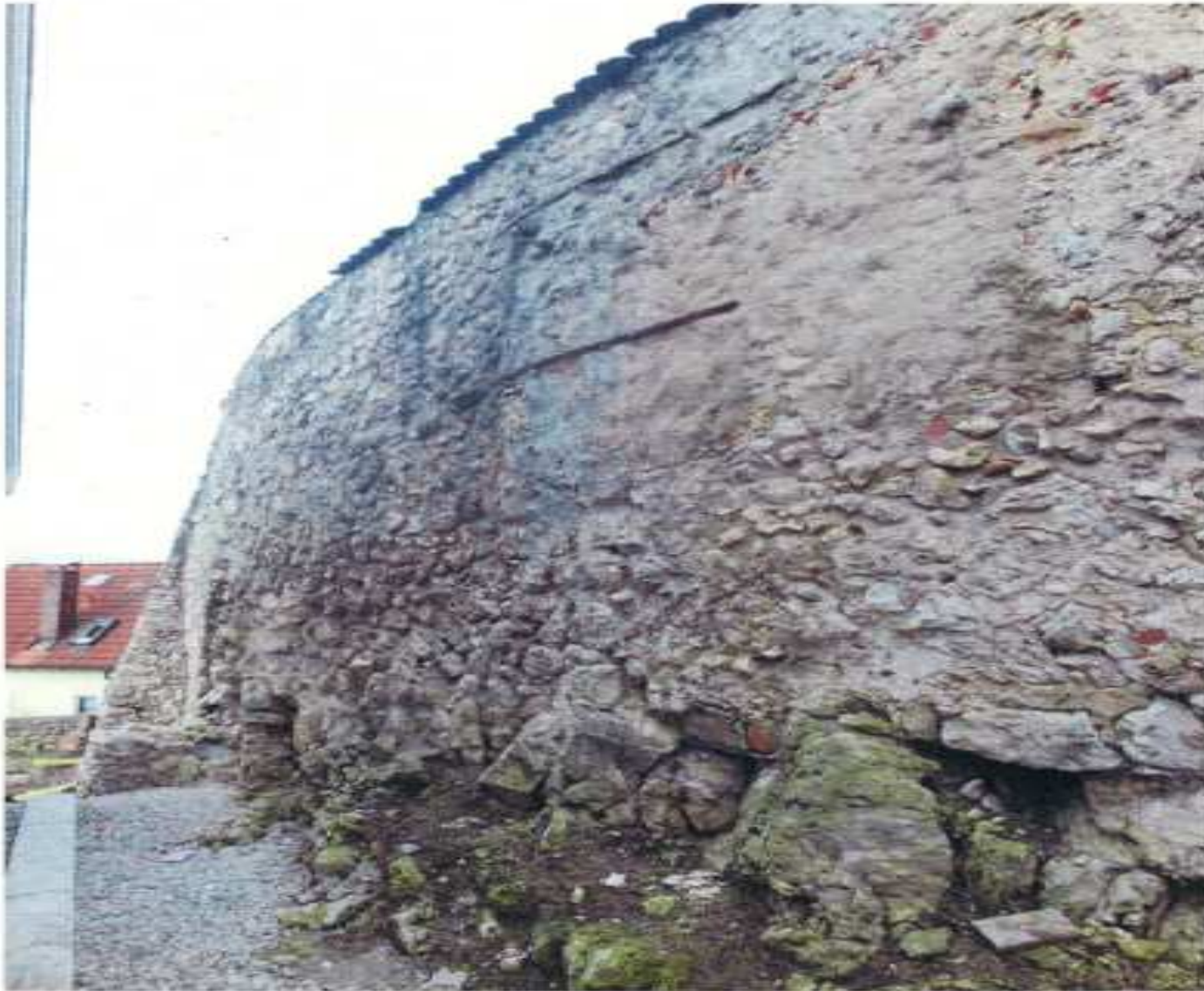
Abbildung 5: Mauerabschnitt „Krotter“. Es sind die Verformungen und die Eisenbänder zur Sicherung zu erkennen. Im unteren Bildabschnitt der anstehende Felsen auf den die Mauer gegründet ist. Aufgrund des rückwärtigen Feuchtigkeitsandranges haben sich auf den Mauern und Felsen angesiedelt. Die Fugen sind dort auch ausgewaschen.