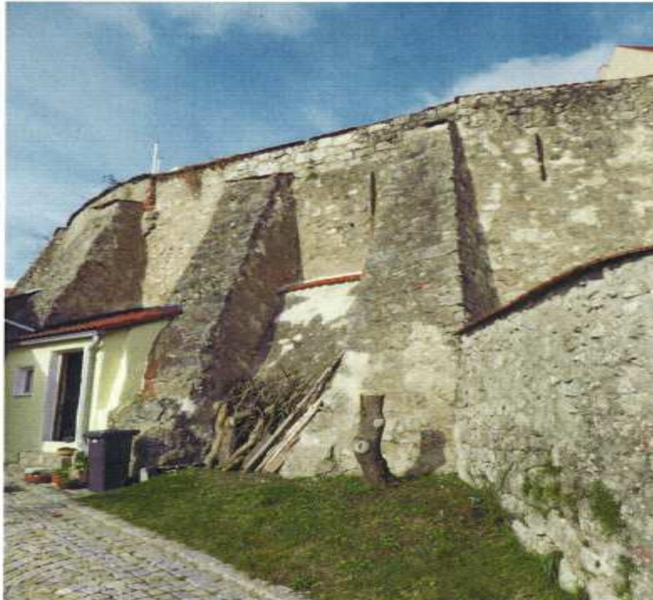
Abbildung 4: Stützpfiler mit Mauer sowie die Schlaudern. Teilbereich des „Markt Lupburg“