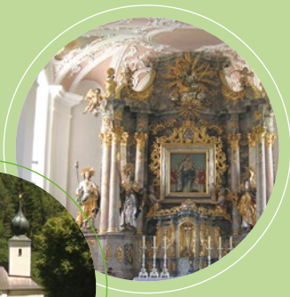
„Mariä Geburt“ im Lengnabachtal